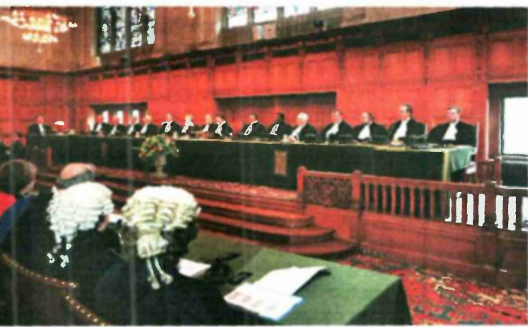
אין בית מחוקקים בינלאומי, וגם בית הדין הבינלאומי רשאי לדון רק מדינות שחתומות על האמנה שיצרה אותו. בית הדין הבינלאומי בהאג

מהי בכלל הסמכות המשפטית של השופט גולדסטון לשפוט את ישראל?