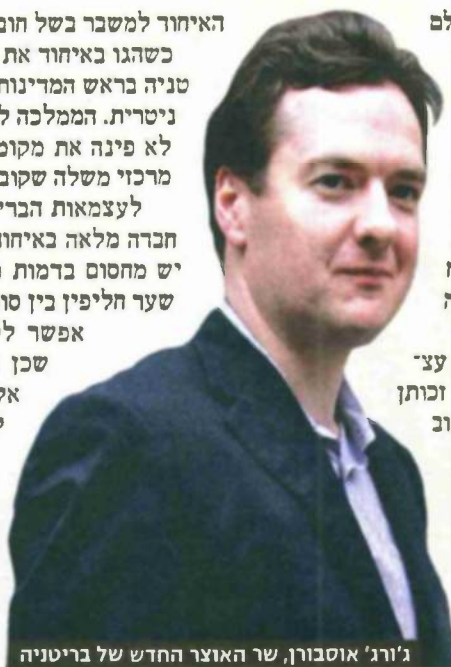
ג'ורג' אוסבון, שר האוצר החדש של בריטניה

מצד שני, יש מי שטוענים שזה לאו רווקא חיסרון. הרי מאחר שכרייטניה יכולה לשלוט טוב יותר בכלכלתה, סיכוייה להיקלע למשבר עשויים להיות נמוכים יותר.