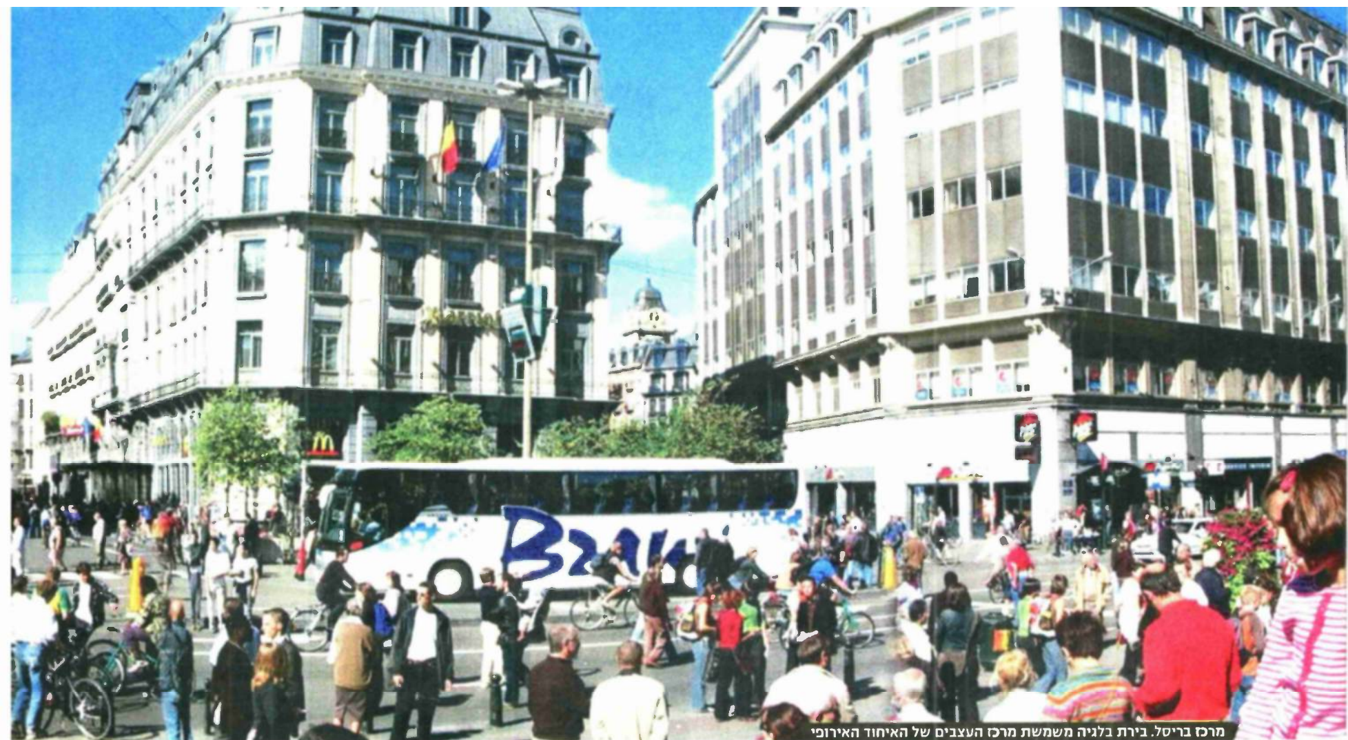
מרכז בריסל. בירת בלגיה משמשת מרכז העצבים של האיחוד האירופי