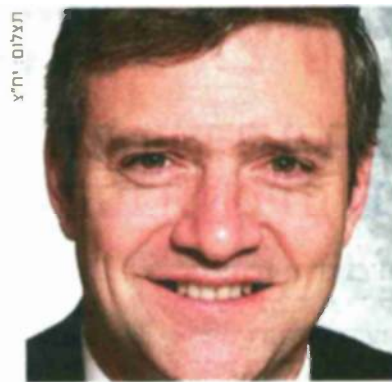
פרופ' אריה ריין

הוא רווקא הנציבות האירופית, שהיא הזרוע המבצעת. זהו גוף על-לאומי ובו יושבים נציגי כל המדינות החברות. משימתם היא לראות את טובת האיחוד לנגד עיניהם, גם אם הדבר פוגע במדינת האם שלהם. מעבר לכך מפעיל האיחוד האירופי בית משפט משלו ובנק אירופי מרכזי (ECB).